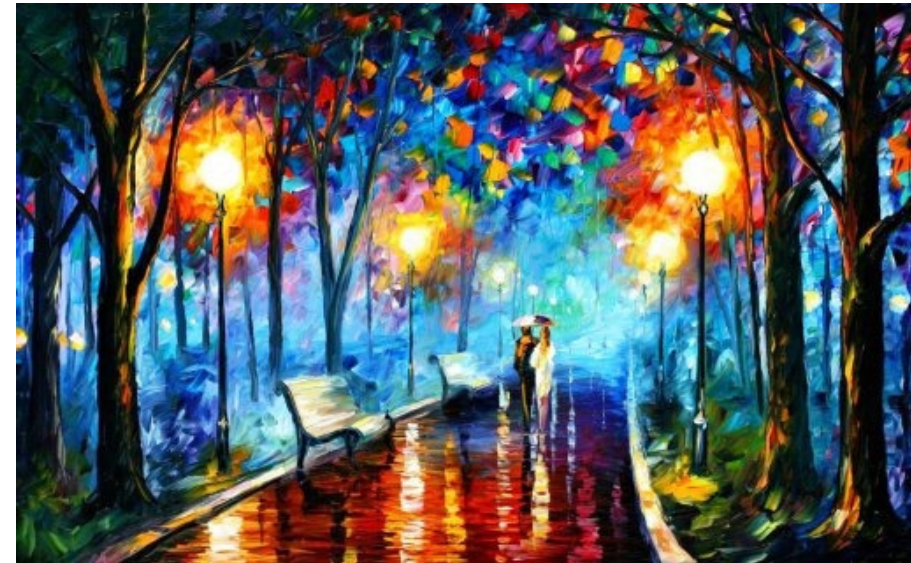
Vincent van Gogh

Concepimento, gravidanza e parto diventano probabilmente un trauma sia per il bambino che per sua madre, se la madre è già stata traumatizzata in precedenza