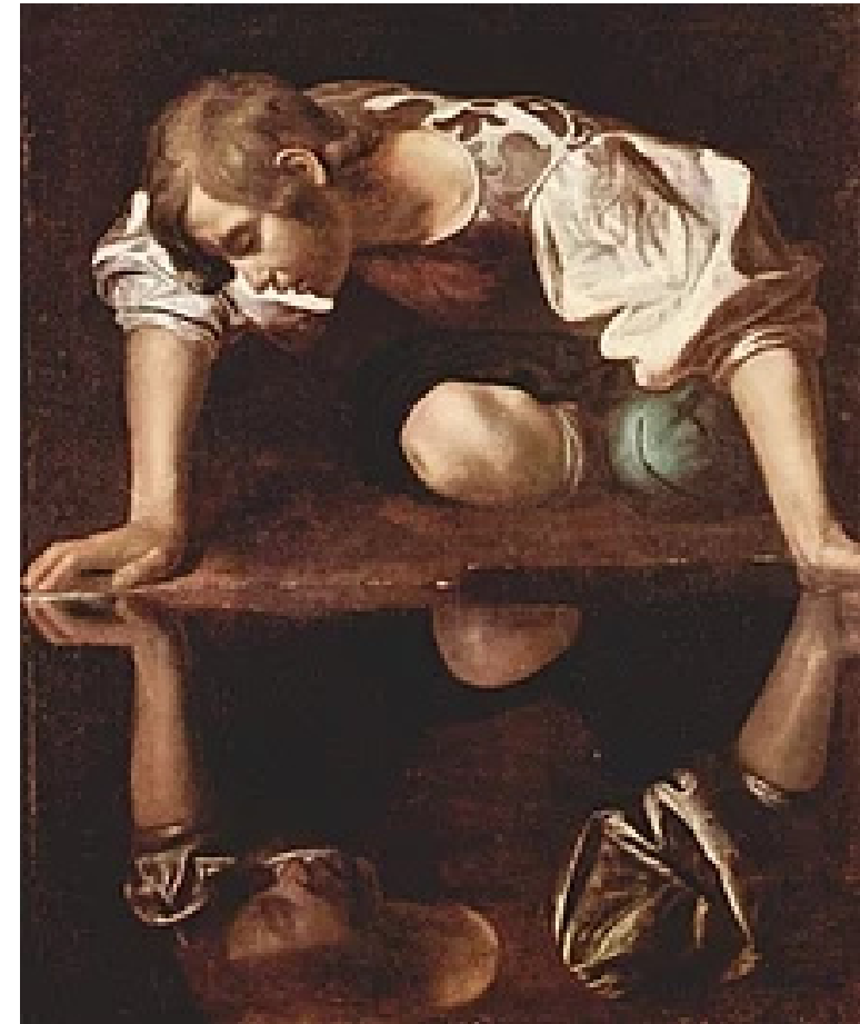
Narziss , Ölgemälde von Caravaggio , 1594–1596, Galleria Nazionale d'Arte Antica, Rom

https://de.wikipedia.org/wiki/Narziss , abgerufen am 5.8.2019